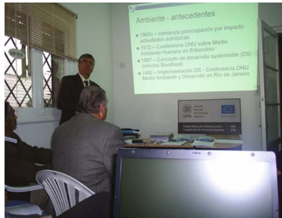
Exposición experto europeo