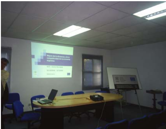
Seminario Rocas y Minerales