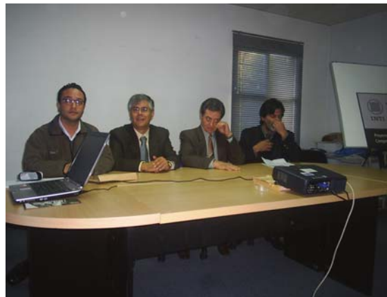
Disertación del experto europeo