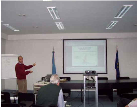
Exposición Dr. Riús Ferrús

5 al 14 de septiembre de 2006, Buenos Aires