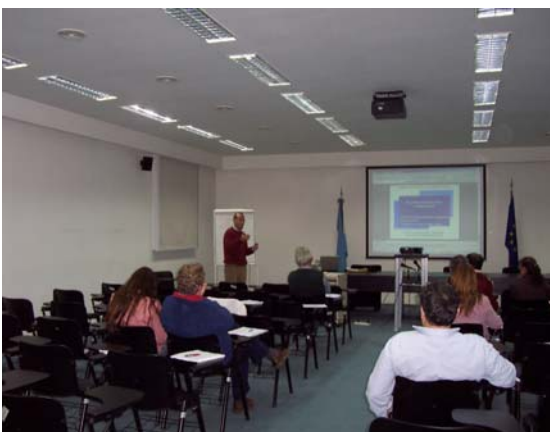
Exposición del experto