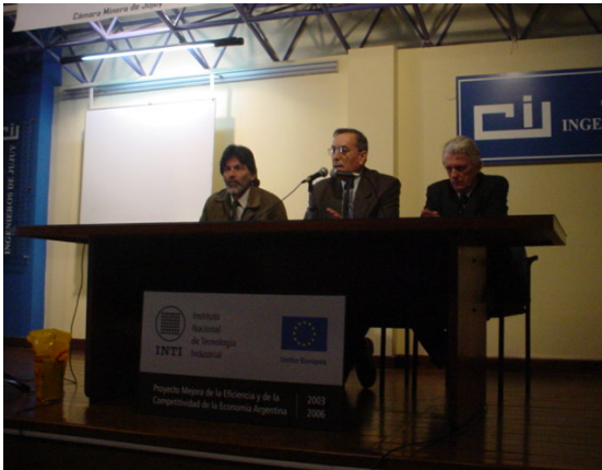
Disertación del experto europeo