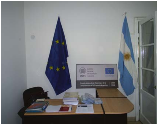
Seminario Rocas y Minerales