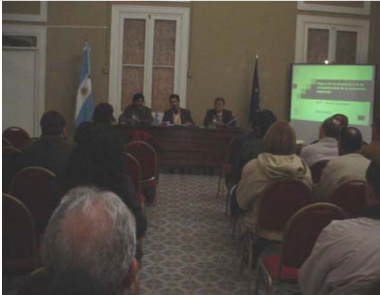
Disertación experto europeo